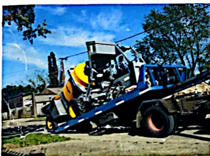
Pendiente superable 65 %.

Nos reservamos el derecho de cambiar cualquier especificación técnica sin previo aviso.