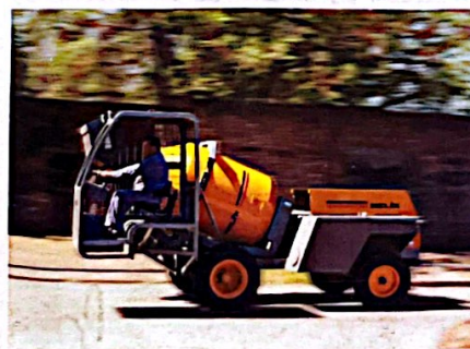
Velocidad 20 km/h.